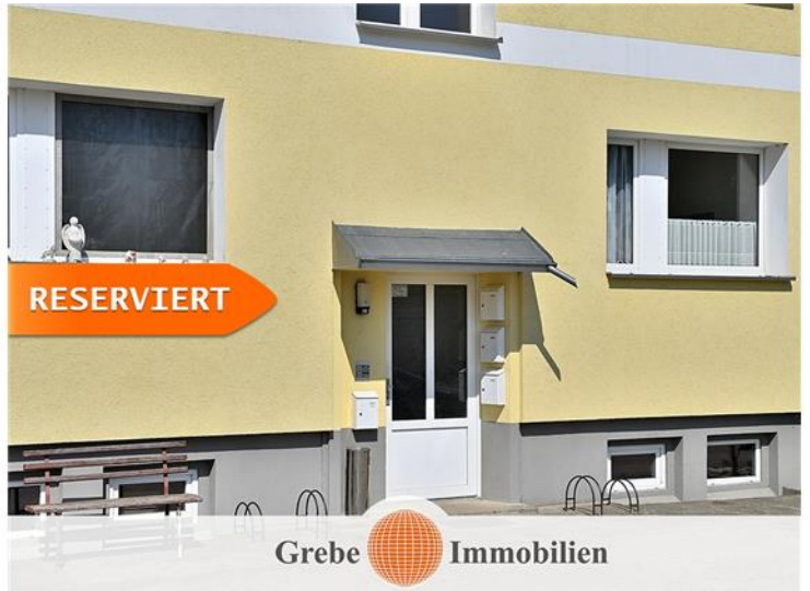
2 Etagen + Vollkeller