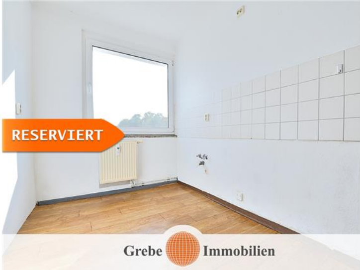
Whg Bsp. Küche