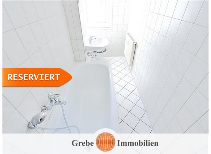
Whg Bsp. Bad