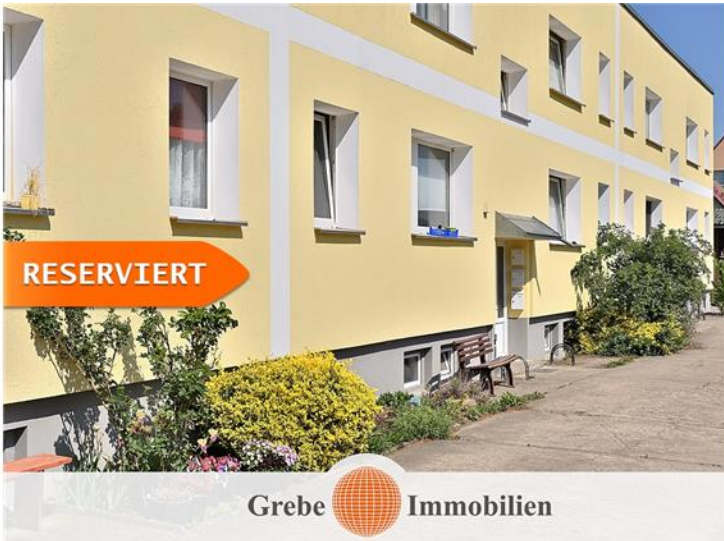
12 Whg a 58 qm