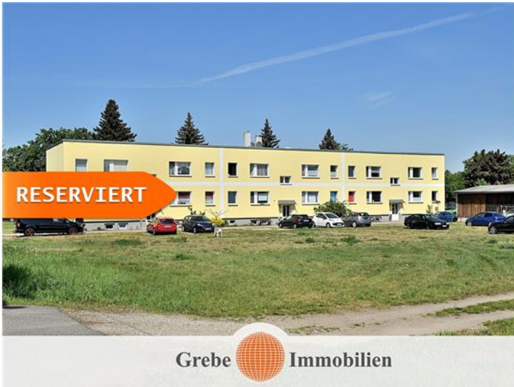
Jüterbog / Kloster Zinna