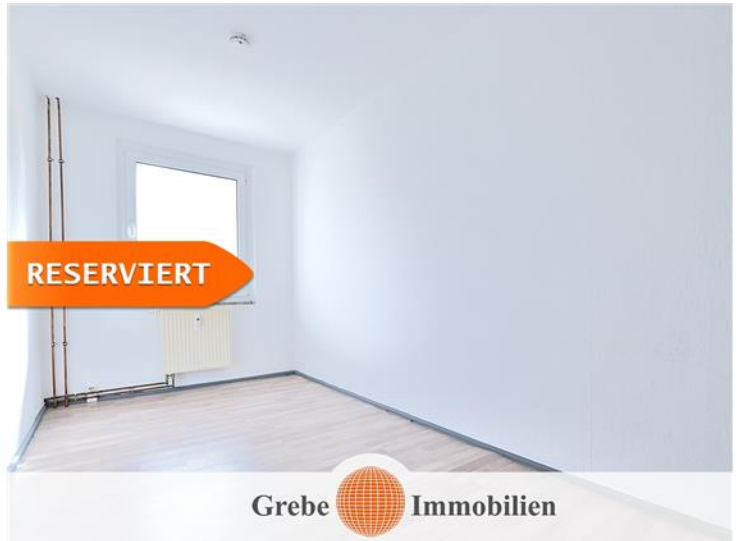
Whg Bsp. Schlafzimmer