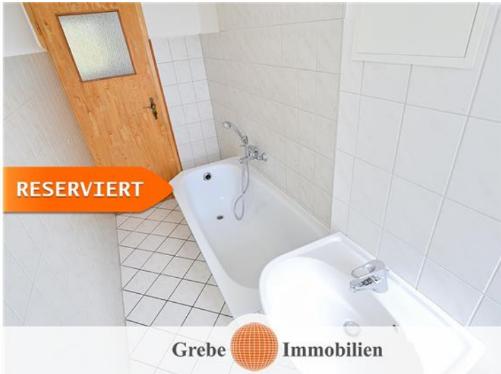
Whg Bsp. Bad 2